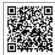
「シラバス」「履修要覧」「授業時間割表」 QRコード