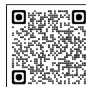
各種方針や「身につく力」のページはこちら