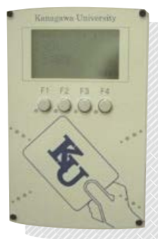
(出席管理システムの端末の例)

授業開始前までに必ず学生証を講堂の壁に設置されている出席管理システムの端末にかざしてください。なお、出席登録は授業開始時刻の10分前からとなります。