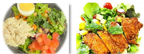
ひよこ豆とささみのチョップドサラダ フライドチキンのチョップドサラダ